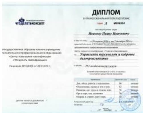
Диплом о переподготовке