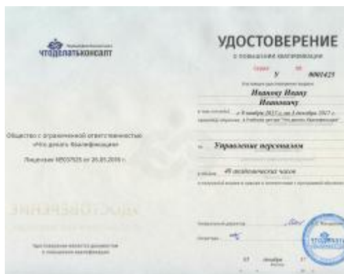
Удостоверение о повышении квалификации