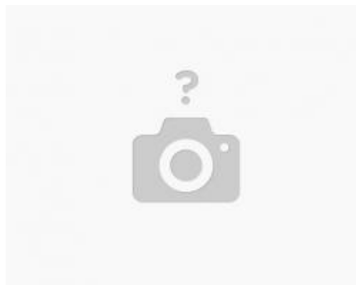
40 Часов ИПБ России за семинар