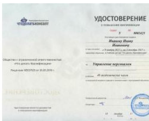
Удостоверение о повышении квалификации