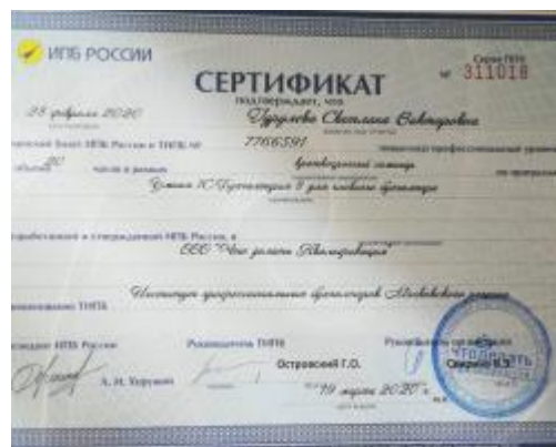
20 Часов ИПБ России