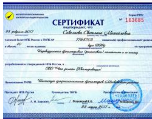
40 Часов ИПБ России за семинар