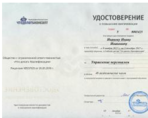
Удостоверение о повышении квалификации