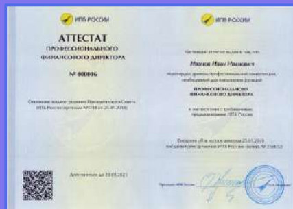
Аттестат профессионального финансового директора после успешной сдачи экзамена в ИПБ России

Сведения о пройденном слушателем курсе вносятся в специальную федеральную информационную систему ФИС ФРДО .