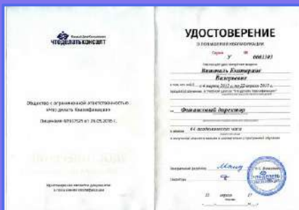
Удостоверение о повышении квалификации после обучения в УЦ «Что делать Квалификация»