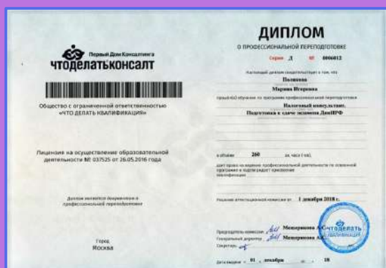
Диплом УЦ «Что делать Квалификация» о профессиональной переподготовке