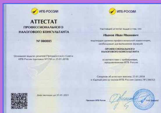
Аттестат профессионального налогового консультанта ИПБ России

Диплом о профпереподготовке — результат пройденного курса и итогового тестирования в УЦ. Аттестат профессионального налогового консультанта вы получаете в случае успешной сдачи экзаменов в ИПБ России.