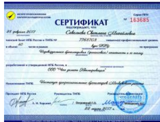
40 Часов ИПБ России за семинар