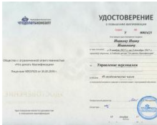
Удостоверение о повышении квалификации