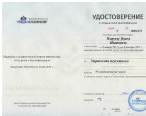
Удостоверение о повышении квалификации